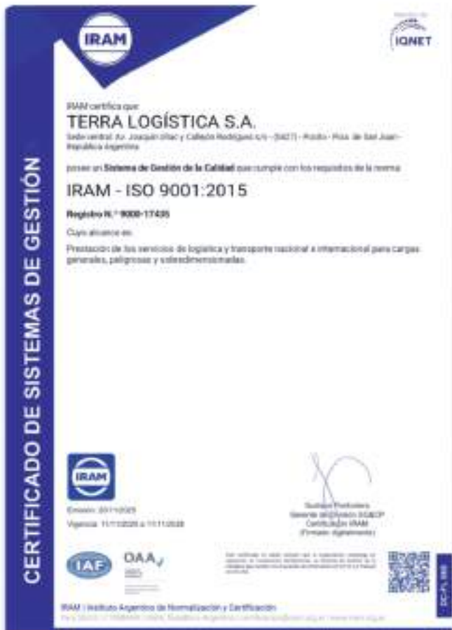
IRAM - ISO 9001:2015 Registro N° 9000-17435

Certificados que respaldan nuestro compromiso con la calidad